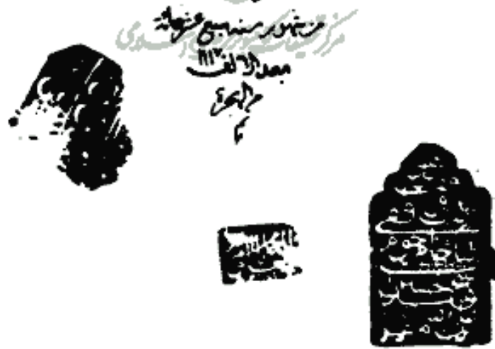
« صورة الصفحة الأخيرة من النسخة ك » « نسخة كربلاء »

في ثلاث فاضلها من الواو اربعة من الياو اربعة ونحوها ايضا حذو من الياو اربعة ونحوها فالواو اربعة والنون اربعة وبعدها اربعة ونحوها ايضا حذو من الياو اربعة ونحوها الضمة اي جمع الى طاوية وايناه وفي كبر اخذوا ناله وبعده حذو من الياو اربعة ونحوها الذرة والياء الفاسخ وقد حذو من الياو اربعة ونحوها ايضا حذو من الياو اربعة ونحوها اياه ما اذ الياو التي في طائفة الباشق والجمع الياء والياء في واو اربعة ونحوها يروى ذكره فلان قالوا نعم يا اي نعم يا اي نعم يروى واو اربعة ونحوها اي يا هذا وهو لم يروى الا بضد واو اي الياو لا اجدوا الياو في حروف قسدا يا وية افا كانت على الياو وياية كذلك وقبل من ياء ويثبت يا حسنة قد وقد اتفق الفرع من نسخة في حروف