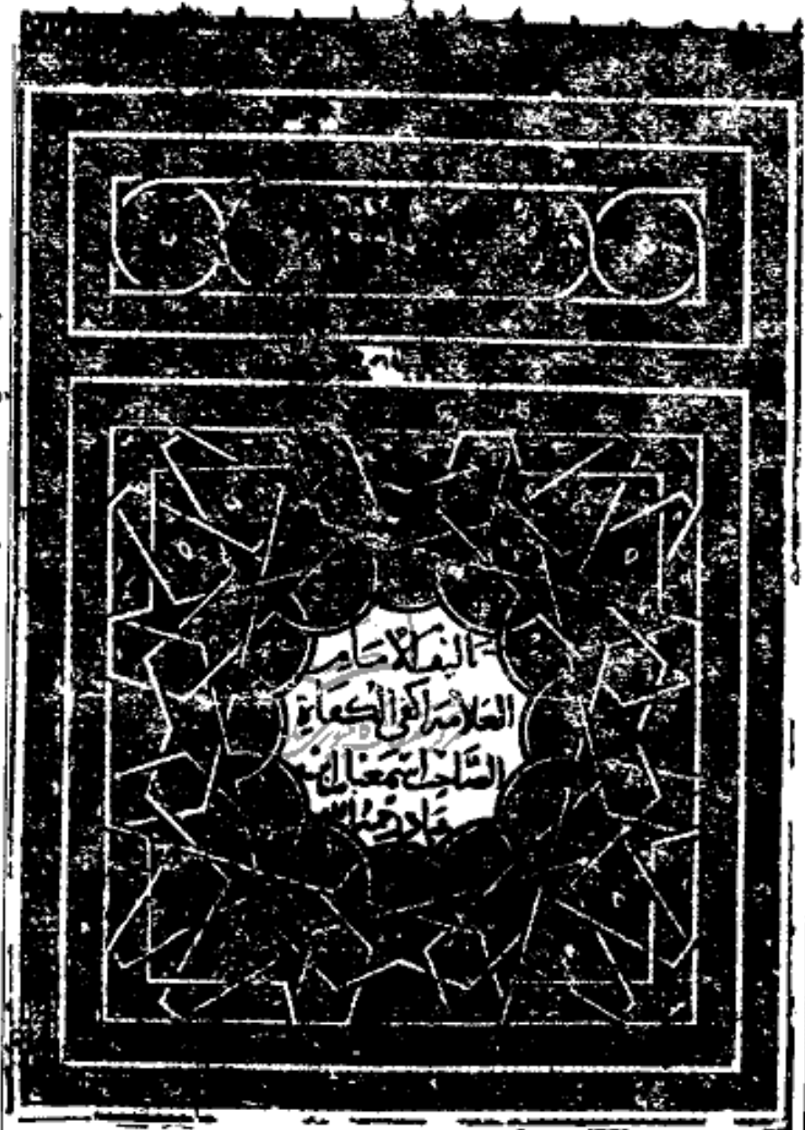
« صورة الصفحة ١/١ من النسخة الأصل » « نسخة المتحف البريطاني »

تم فصله من نسخة المفرد الأصغر من نسخة صاحب المخطوط في سنة ١٢٠٠ هـ